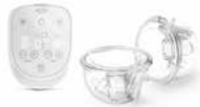
ardo alyssa hands-free