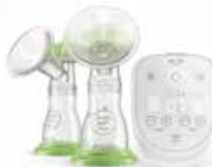
ardo alyssa double

Relevante Kriterien bei der Wahl einer Milchpumpe: