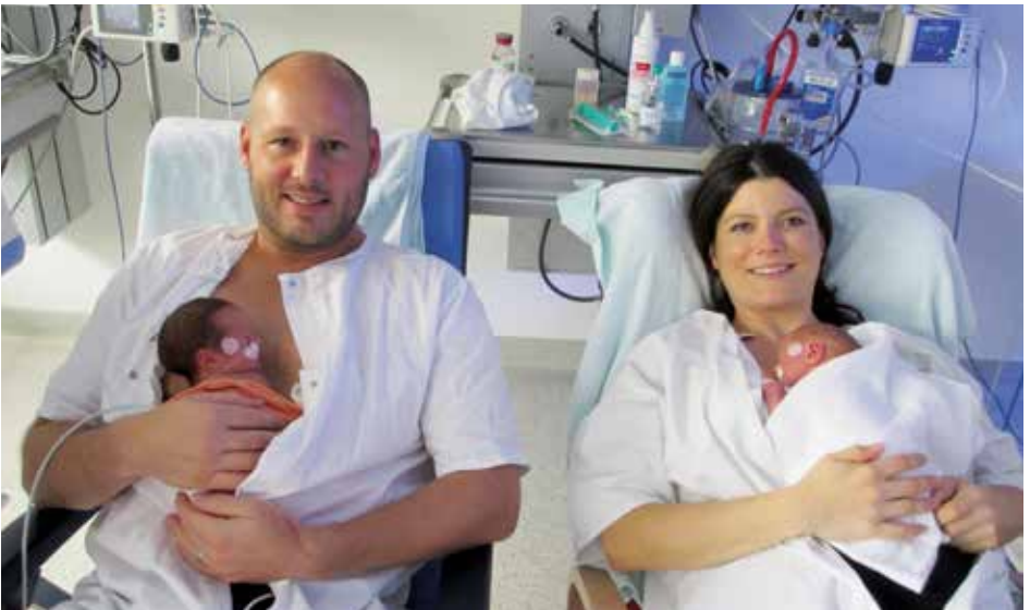
Bonding – der natürliche und innige Kontakt auch bei Frühgeborenen.

Sollte das Bonding nicht möglich sein (z.B. bei Frühgeborenen), kann die Anfangsphase jederzeit nachgeholt werden. Lege dein Baby für einige Stunden auf die nackte Brust. Auch der Partner kann so den natürlichen und innigen Kontakt genießen.