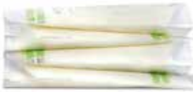
z. B. mit dem Milchbeutel Ardo Easy Store platzsparend gestapelt

Je hygienischer Muttermilch abgepumpt wird, desto länger kann sie aufbewahrt werden. Dazu eignen sich Milchbeutel. Vorzugsweise wird jede Portion (60 bis 120 ml) einzeln abgepumpt, im Kühlschrank abgekühlt und danach sofort eingefroren.